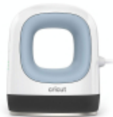
Presse à chaud Easy Press Mini zen bleu - Cricut