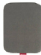
Tapis Easy Press 20 x 30,5 cm - Cricut