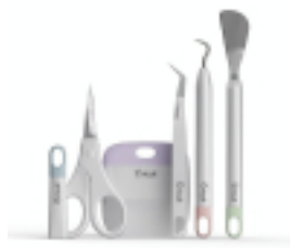
Outils basiques Set 5 pièces - Cricut