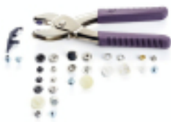
Mallette Vario Plus pour Bouton-pression et Œillets - Prym