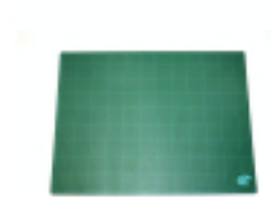
Plaque de coupe 60 x 90 cm - Artist Art Materials 45,95 €