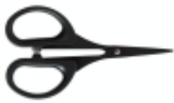
Ciseaux de précision en teflon antiadhérents - Artemio 7,99 €