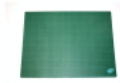
Plaque de coupe 30 x 45 cm - Artist Art Materials