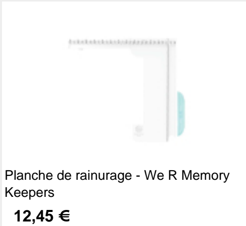
Planche de rainurage - We R Memory Keepers