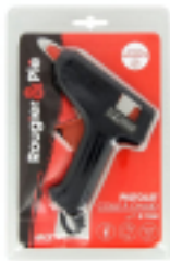
Pistolet à colle R&P Ø 7 mm - Rougier&Plé