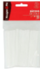
Bâtonnet de colle tout usage R&P Ø 7 mm x 10 cm - 25 pcs - Rougier&Plé