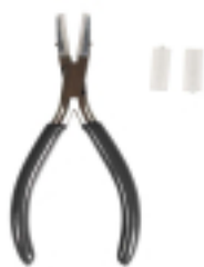
Pince plate Mâchoires en plastique - Rayher