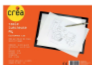
Table lumineuse à LED A4 -...